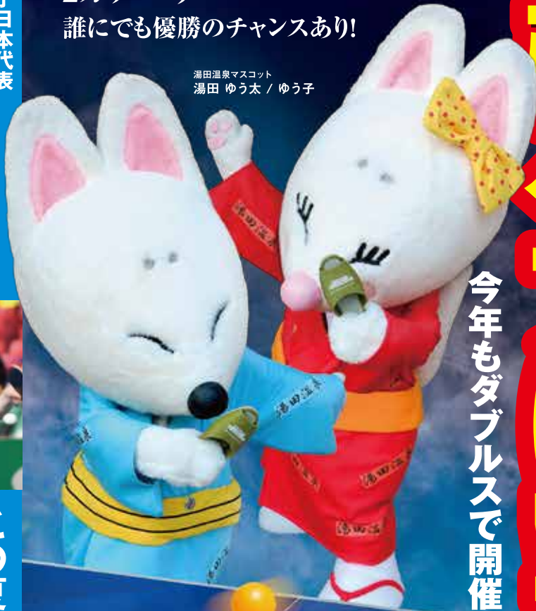
湯田温泉マスコット 湯田 ゆう太 / ゆう子