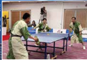
熱戦を繰り広げる 参加者(昨年の大会から)